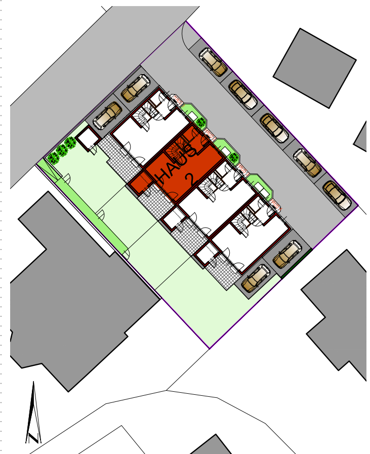
LAGEPLAN M 1:500